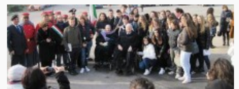
Fiano Romano-Open Day-Piazza Martiri di Nassirya